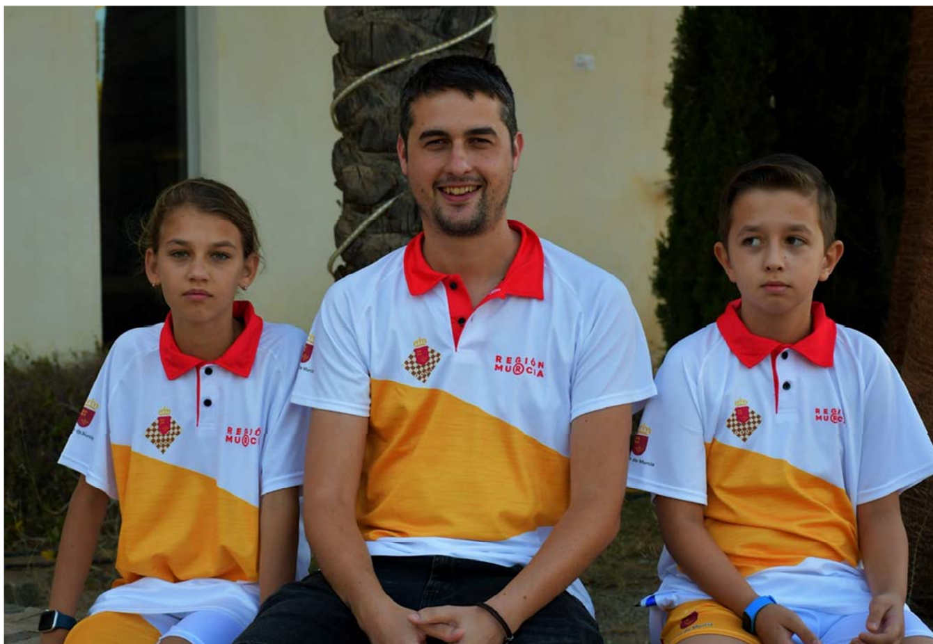
Participantes y delegado Región de Murcia