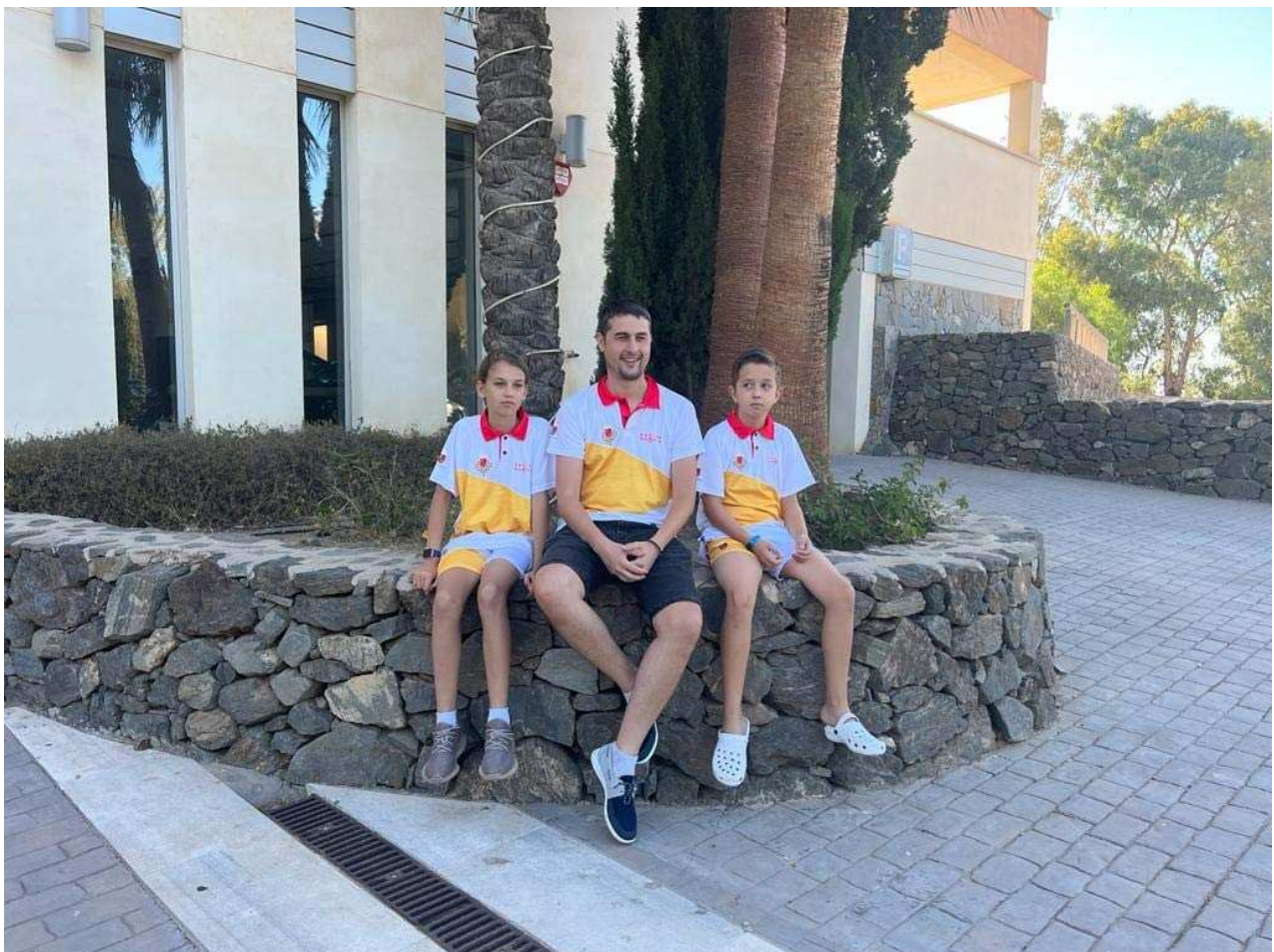
Delegado y jugadores