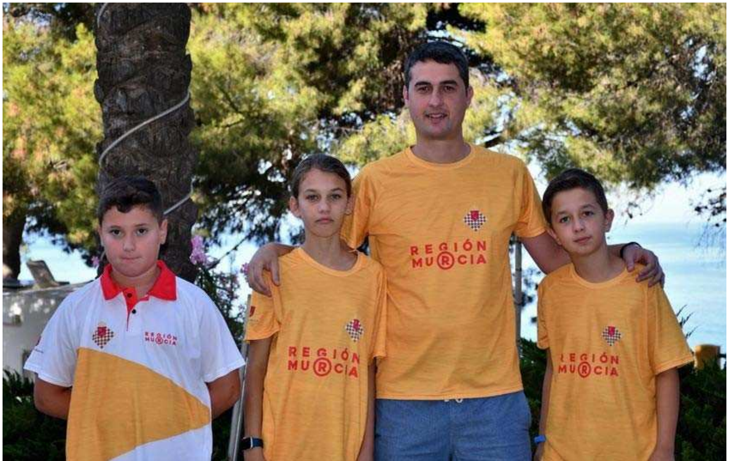
Participantes Federación Ajedrez Región de Murcia