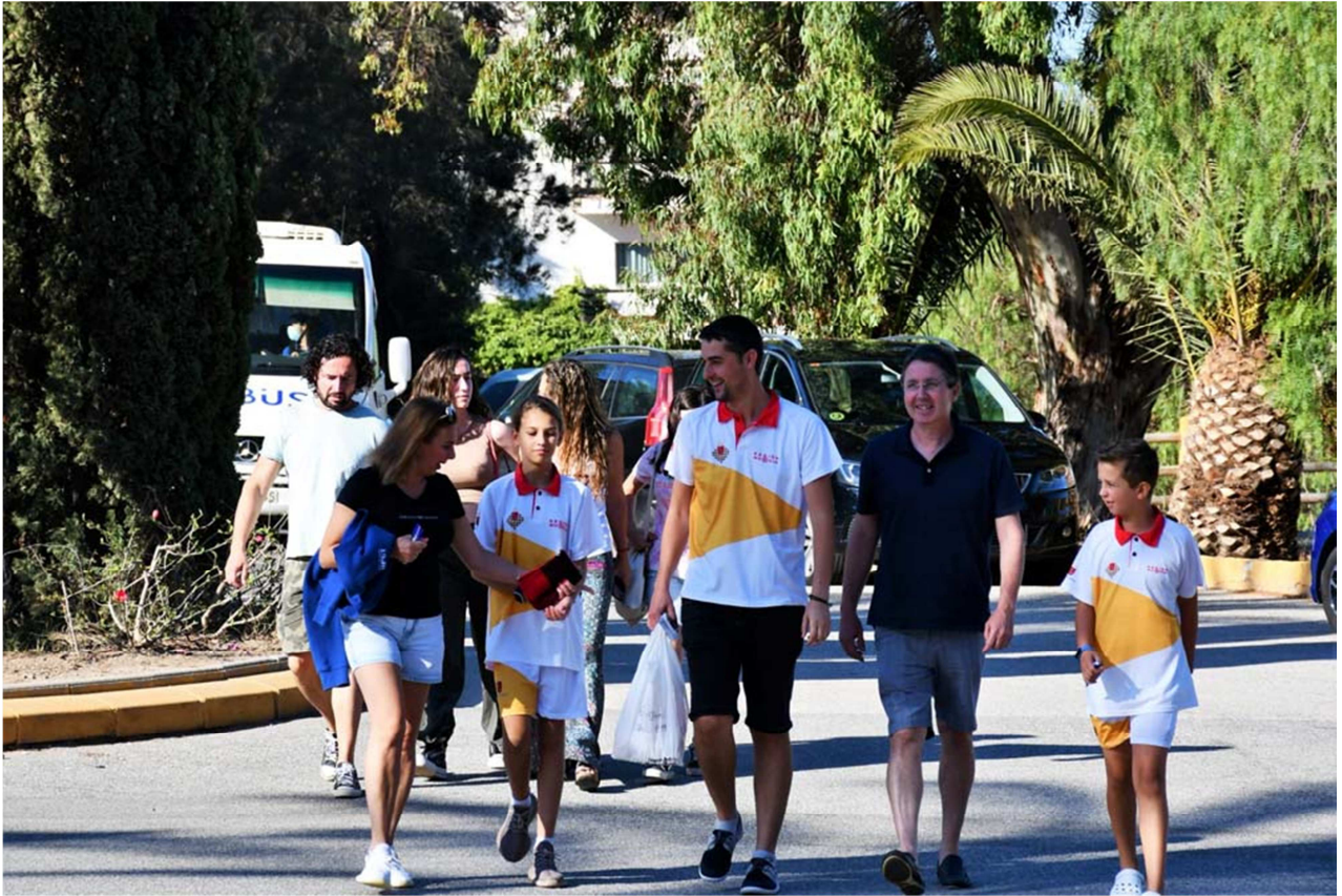
Hacia la sala de juego

C/. Alfonso XIII, 101-LOS DOLORES 30310- CARTAGENA (Murcia) Tel/Fax. 968 12 61 62 www.farm.es e-mail: farm@farm.es