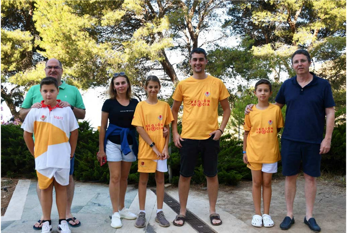
Participantes F.A.R.M y familiares

C/. Alfonso XIII, 101-LOS DOLORES 30310- CARTAGENA (Murcia) Tel/Fax. 968 12 61 62 www.farm.es e-mail: farm@farm.es