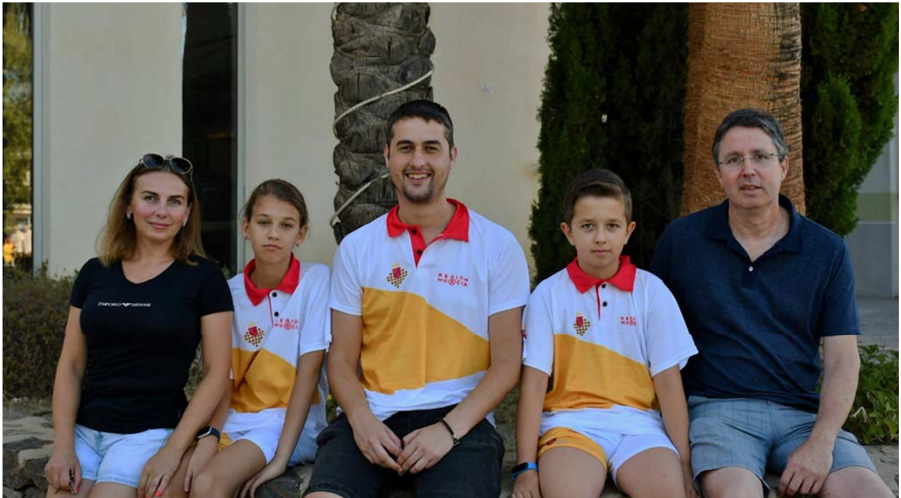
Jugadores/delegado y familiares