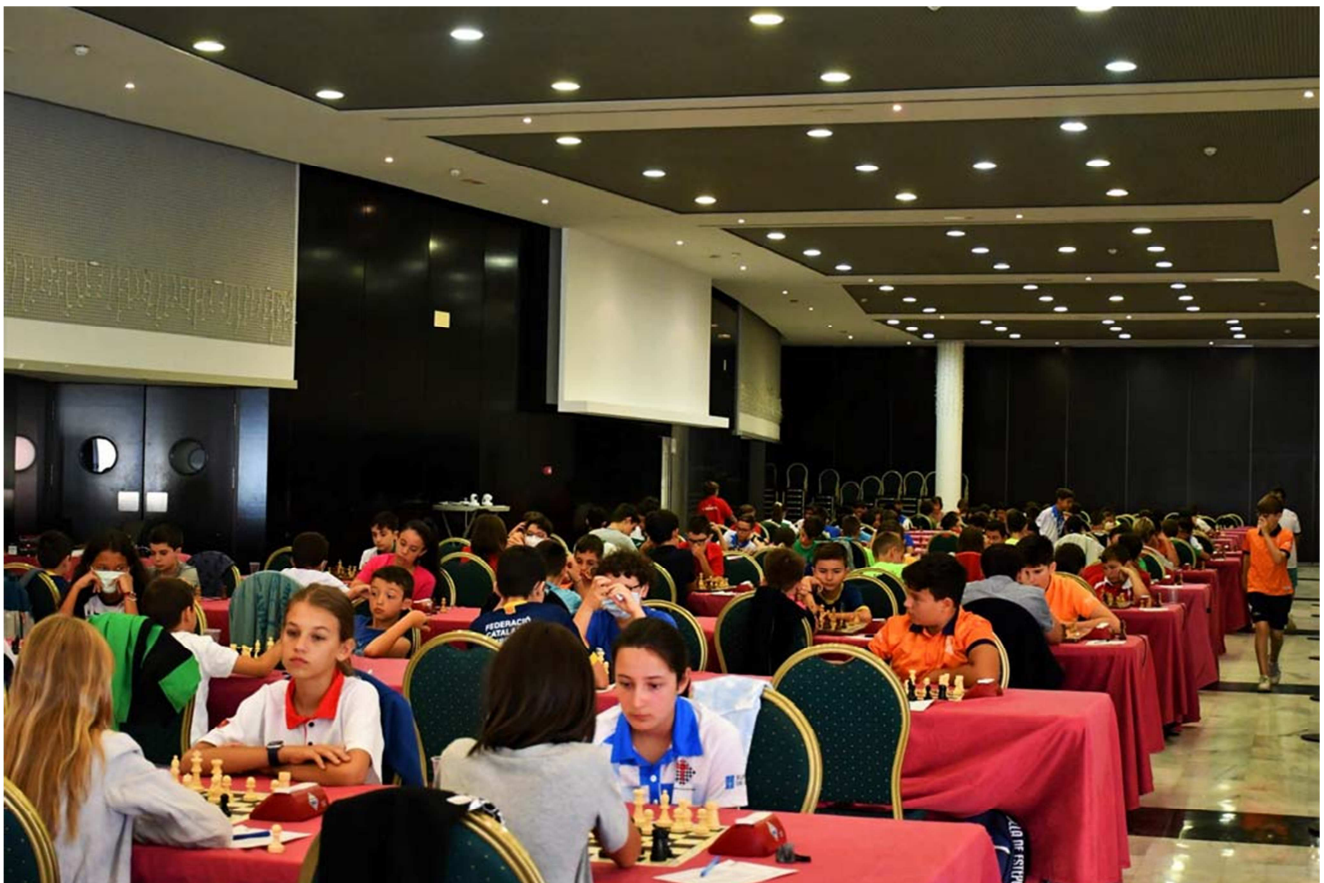
Sala de juego

Campeonato de Espana Sub 12 2022 - https://info64.org/campeonato-de-espana-sub-12-2022