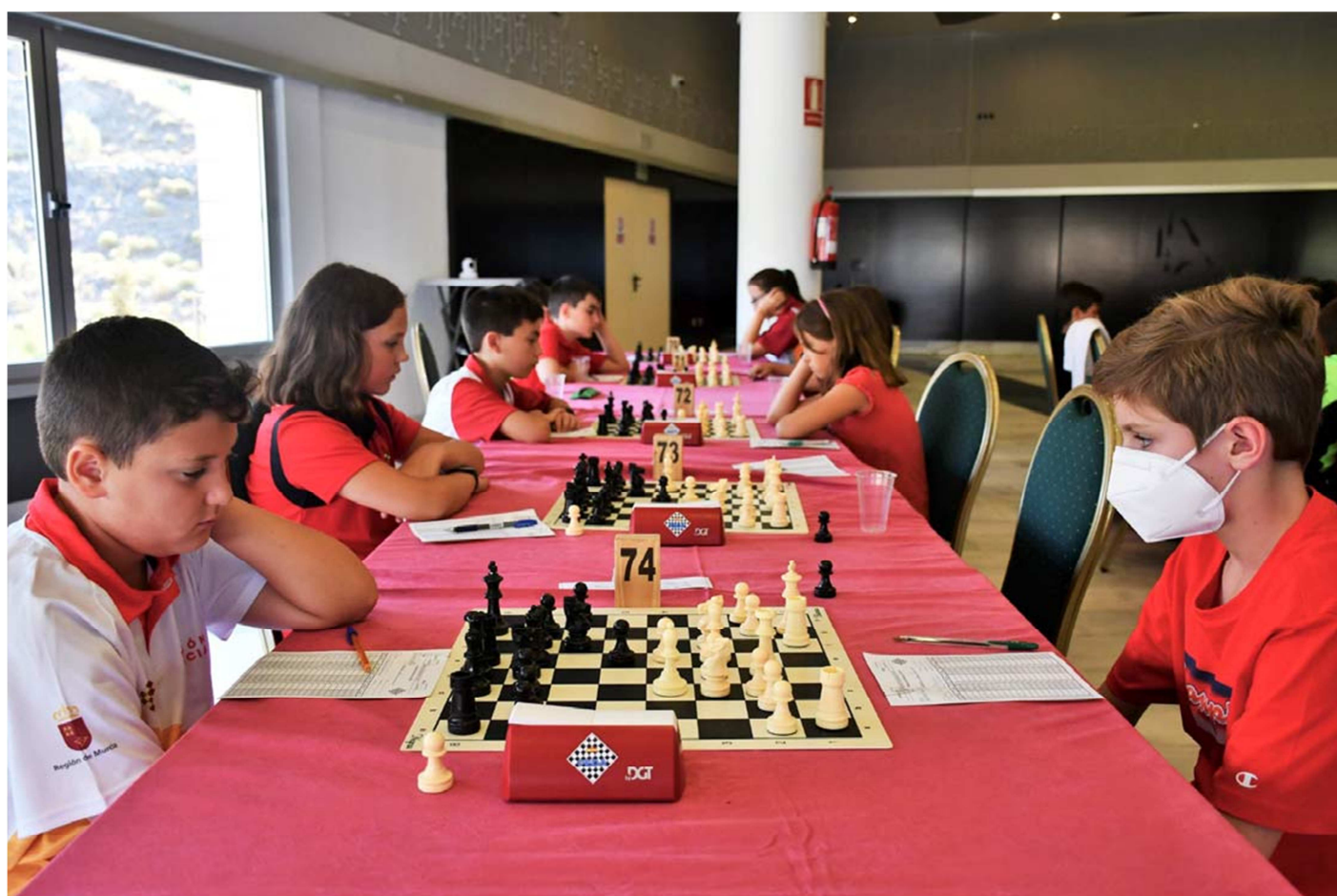
Durante la partida