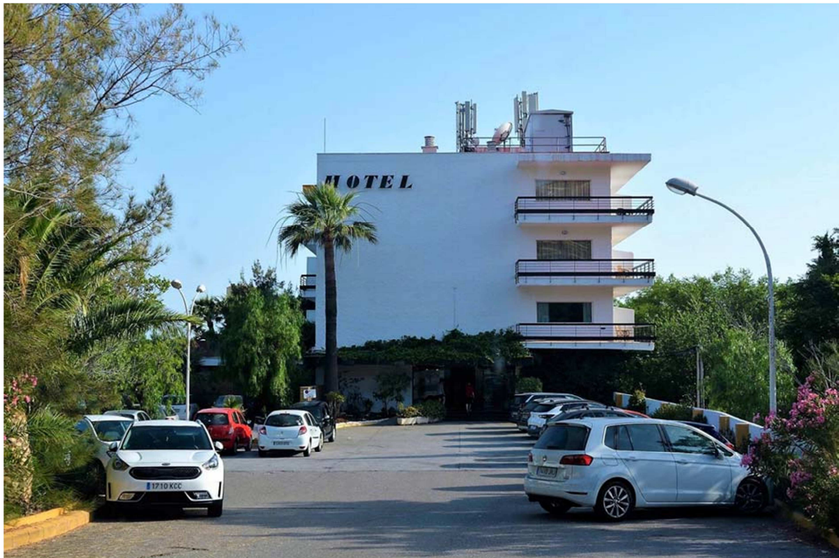
Exteriores Hotel Suites Salobreña