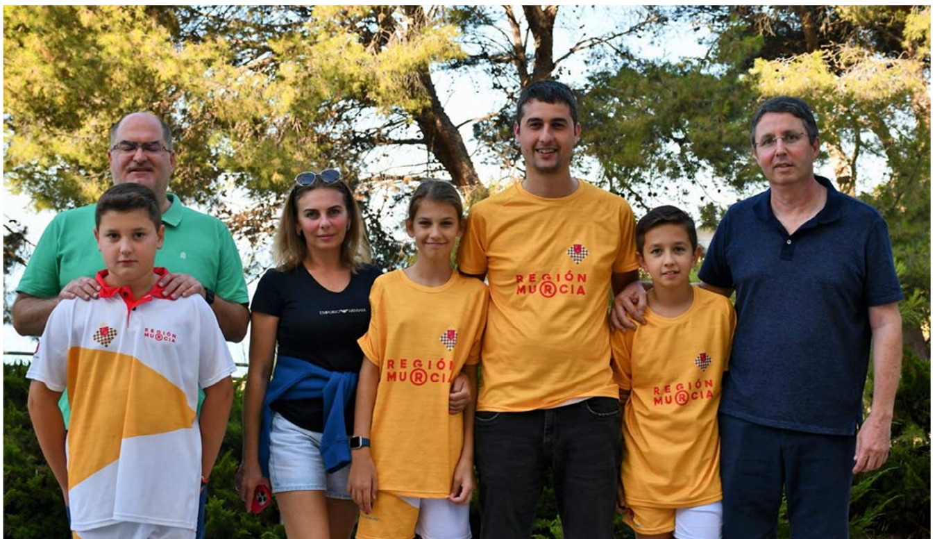
Participantes F.A.R.M y familiares