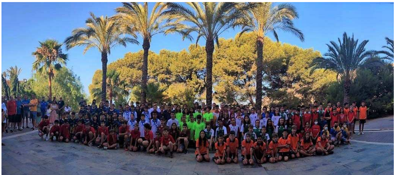
Participantes sub 12